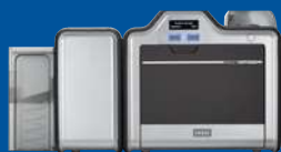
Stampante/codificatore dual side